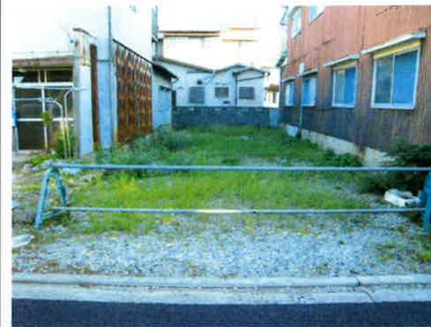
山陽電鉄網干線「山陽網干」駅より車で約5分 有効地積約29.4坪